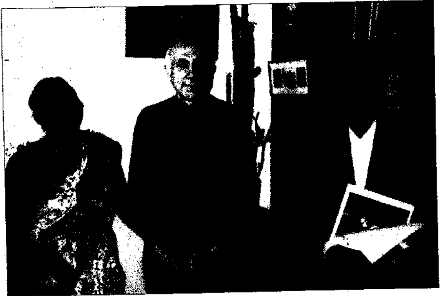
डॉ. मेलविन् केल्विन् यांचे समवेत रंगलेली गप्पांची मैफल