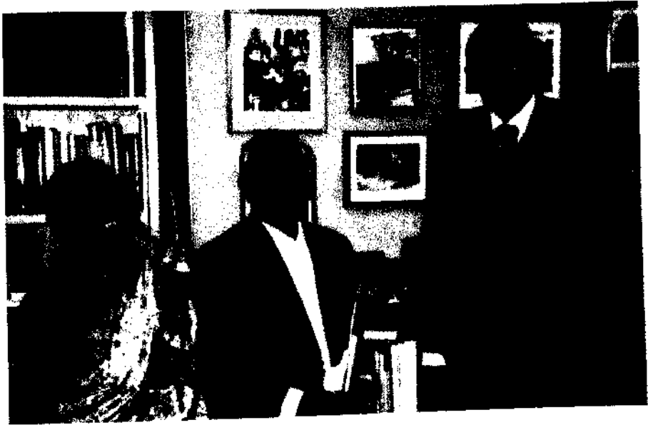
डॉ. ग्लेन टी. सीबोर्ग यांच्या सहवासात काही क्षण